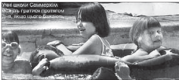
Учні школи Саммерхілл можуть гратися протягом дня, якщо цього бажають.