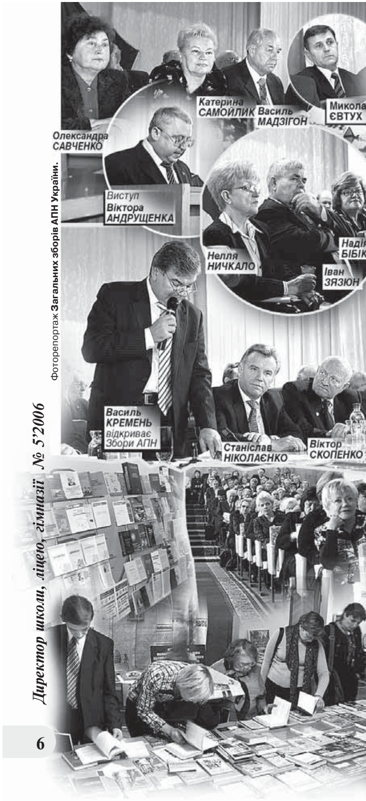
Фоторепортаж Загальних зборів АПН України.

Директор школи, ліцею, гімназії № 5'2006