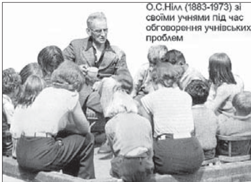
О.С.Нілл (1883-1973) зі своїми учнями під час обговорення учнівських проблем