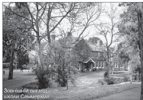
Зовнішній вигляд школи Саммерхілл

Свого часу засновник школи Саммерхілл писав: "Я боюся, що масове виробництво прийшло аби залишитися у торгівлі та освіті. Поставте на кожній дитині один той самий