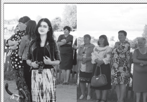
Селяни в очікуванні початку СВЯТА: святковий настрій переважив діловий