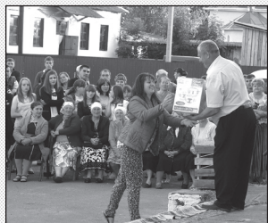
Голова сільради вручає подарунки