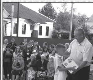
«Відчутний» дарунок: набір каштрель