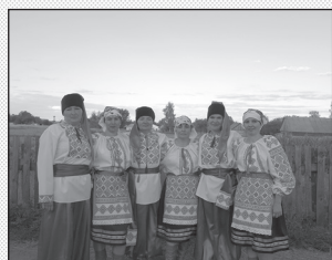
Учасники концерту: танцювальний колектив «Козачки»