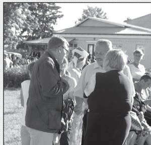
Меценат у колі односельців