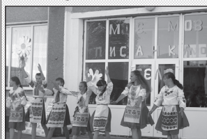
Діти – учасники концерту. На задньому плані, на склі напис: «Мов писанка село» – виявлення почуття любові до свого села