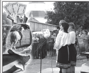
Розіграш лотерейних білетів. Зліва «живі» лоти очікують своїх нових господарів