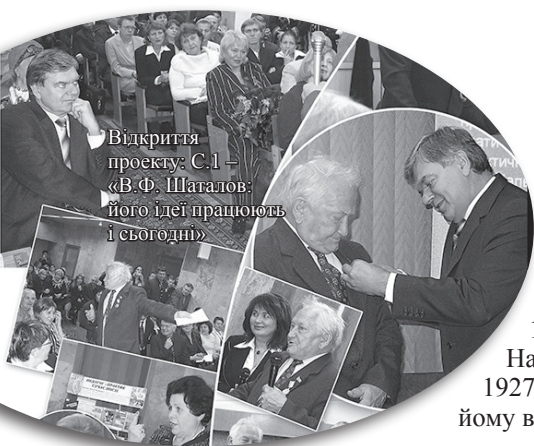
Відкриття проекту: С.1 – «В.Ф. Шаталов: його ідеї працюють і сьогодні»