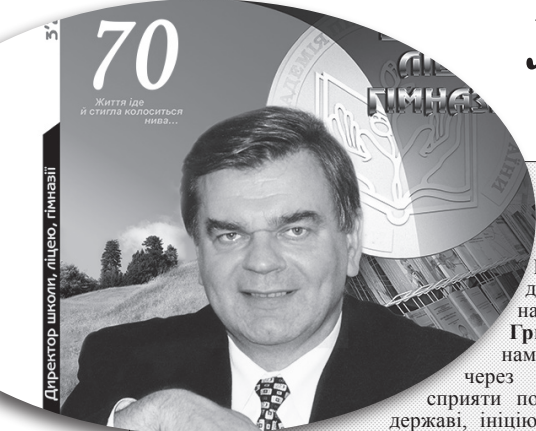
34 Директор школи, ліцею, гімназії