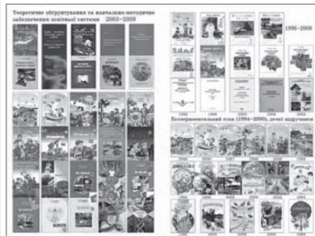
дуть повернуті дітям українського народу.

Значно більший вираз Любові (а також і Віри, Надії, Софійності) в підручниках, посібниках для учнів видавництва «Довкілля-К». В бібліотеках шкіл їх ще можна знайти. Педагоги «Довкілля», співавтори їх (понад 50 вчених, педагогів-практиків, український народ) вірять, що вони ще бу-