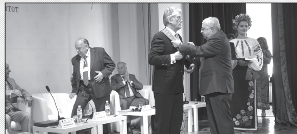
Урочиста мить церемонії нагородження

І саме тому ми, асоціація ректорів університетів Європи, хочемо скласти слова подяки всім президентам, які сьогодні приїхали до університету, та за сприяння у розбудові педагогічної освіти нагородити орденом Міжнародної асоціації ректорів педагогічних університетів за академічні заслуги Л.М. Кравчука , президента 1991-1994 рр., Л.Д. Кучму (1994-2005 рр.), В.А. Ющенка (2005-2010 рр.), П. Лучинського , президента Молдови 1997-2001 рр., С. Шушкевича , голову Верховної Ради Білорусі 1991-1994 рр.